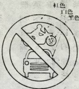
汽車及電單車禁止駛入